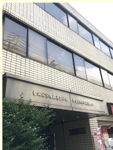
曹洞宗宗務庁第三分館 曹洞宗総合研究センター