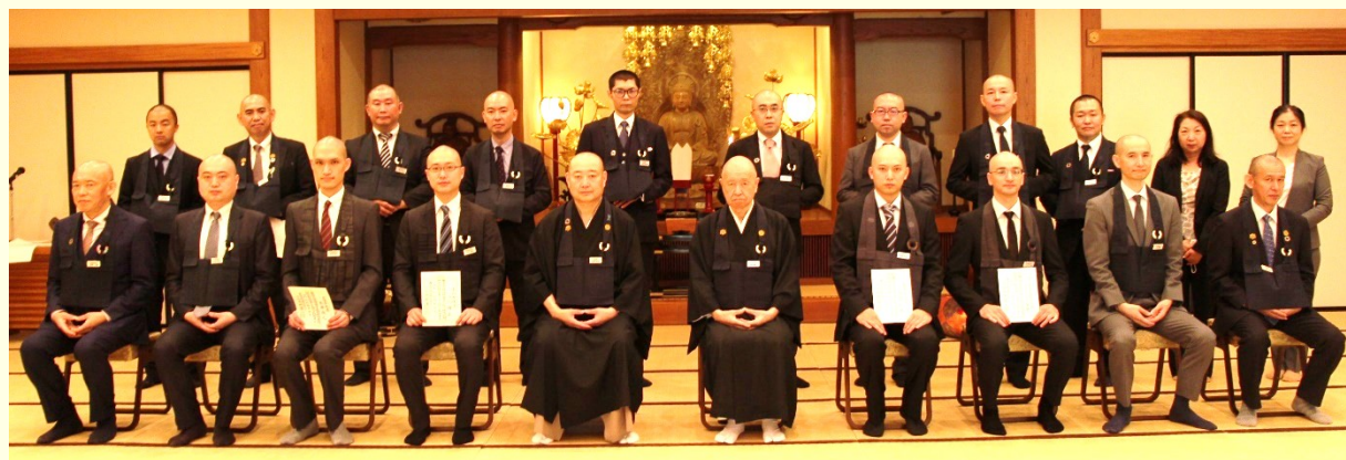
令和2年度曹洞宗総合研究センター入所式