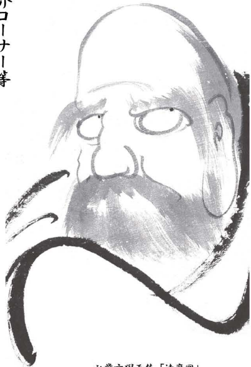
弘徽玄祝画賛「達磨図」 (駒澤大学禅文化歴史博物館所蔵)