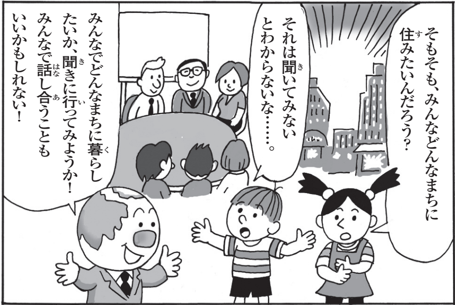
イラスト：倉橋達治